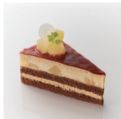
キャラメル ラ・フランス