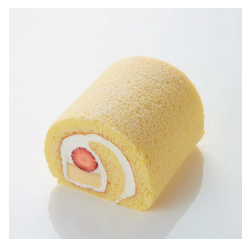
いちごプリンロール