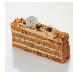
カフェミルフィーユ