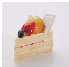
フルーツショート