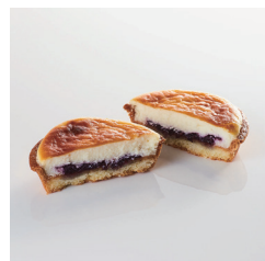
ブルーベリー チーズタルト