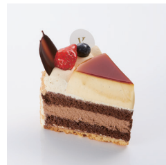
プリンショコラケーキ