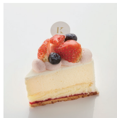
レアチーズケーキ