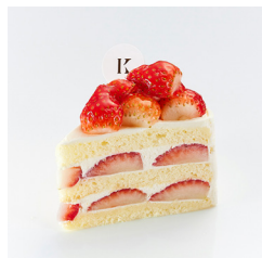
ストロベリークイーン