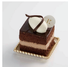
ロイヤル チョコレート