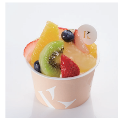
フルーツカップケーキ