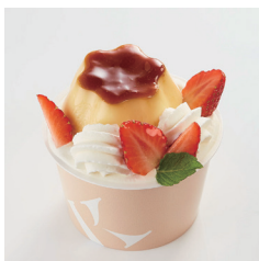
ダブルプリンパフェ