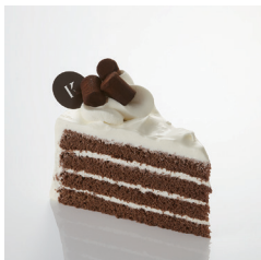
ショコラノワール