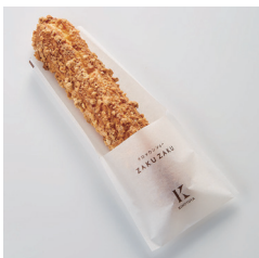
クロッカンシュー ザクザク