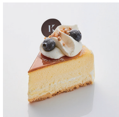
ベイクドチーズケーキ