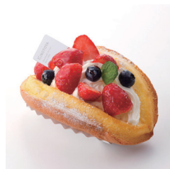
フロマージュベリー オムケーキ