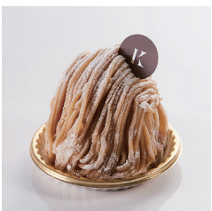
マロンモンブラン