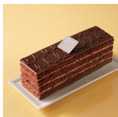
ショコラボックス