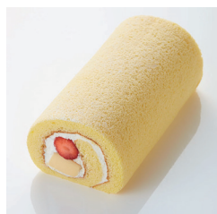
いちごプリンロール