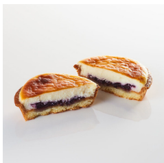
ブルーベリー チーズタルト