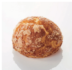
深焼シュークリーム