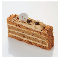
カフェミルフィーユ