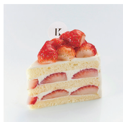
ストロベリークイーン